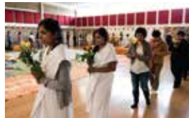
Circumambulation, community of Vimokkharam