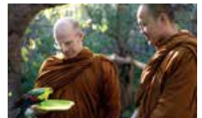
Befriending some of the locals