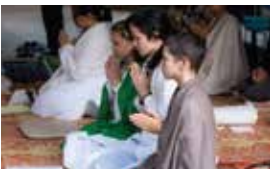
Kulaputtā, children of a good family at Vimokkharam