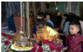
More Kulaputtā, focused on the Buddha during Songkran day celebrations at Vimokkharam