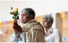
Vesak celebration by the community of Vimokkharam