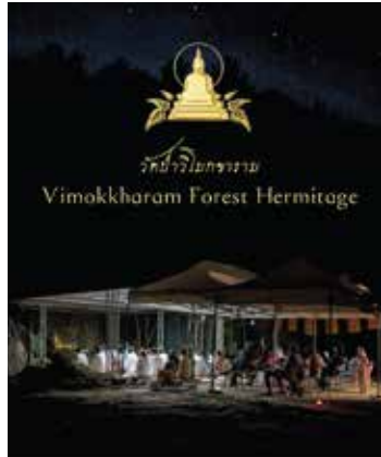
New Year's Eve at Vimokkharam Forest Hermitage