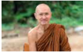
Tan Ajahn Dtun Thiracitto the abbot of Wat Boonyawad in Thailand, visiting Vimokkharam