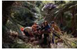
Working bee, saving fern trees relocated from the building site