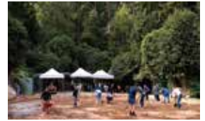
Working bee, site preparations for Buddha-rūpa ceremony