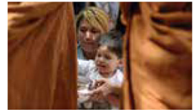
Giving brings joy even at this young age