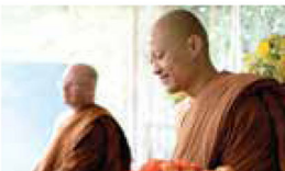
The resident Sangha spreading metta to visitors