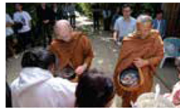
Receiving almsfood at Vimokkharam