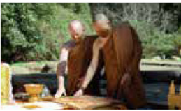
Receiving 'cast-off' cloth at Vimokkharam Forest Hermitage