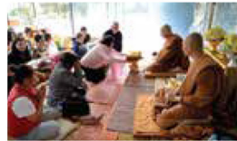
The meritorious act of robe offering