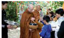
Another beautiful day at the hermitage supporting the Sangha and making merit