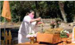
Foundation Stone Ceremony