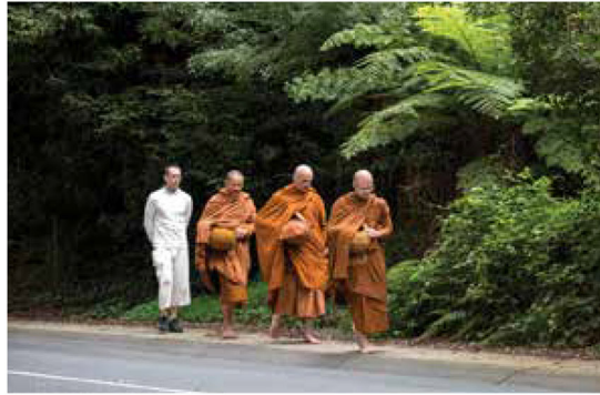
Monks walking to local village for their alms