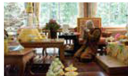
At Wat Pa Baan Taad, Thailand, paying respect to the parinibbana of Luangta Maha Boowa